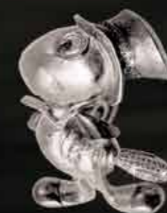
Il Grillo Parlante