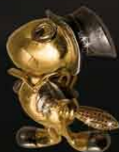
Il Grillo Parlante