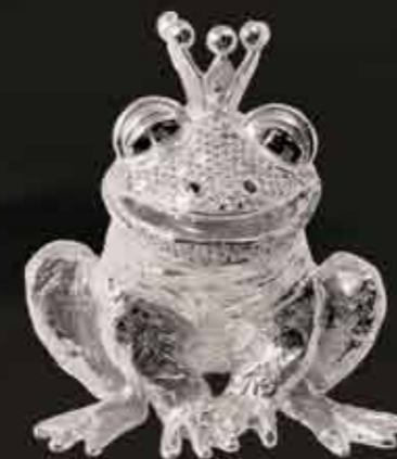
Il Principe Ranocchio

The LE FIABE series, made from lost-wax cast brass on an exclusive design by Fonderia Artistica Lancini, is gold plated and set with precious stones.