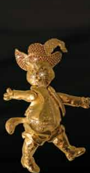
Il Gatto con gli Stivali

These exclusive objects can be used in several ways and have various different functions, lending themselves to the client's imagination and creativity.