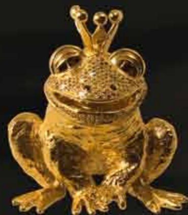
Il Principe Ranocchio

Questi esclusivi oggetti possono essere utilizzati in vari modi e con diverse funzioni, prestandosi alla fantasia ed alla creatività del cliente.