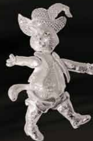
Il Gatto con gli Stivali